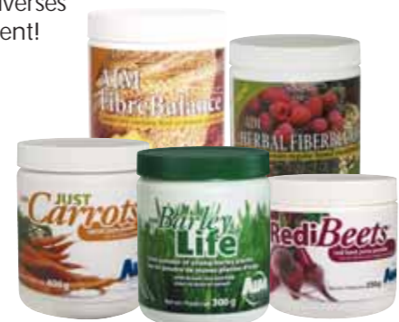
(1) 5568F et (2) 5569F 100 PV

2 AIM Canada™ | Pour commander, appelez AIM au 1-800-933-4246