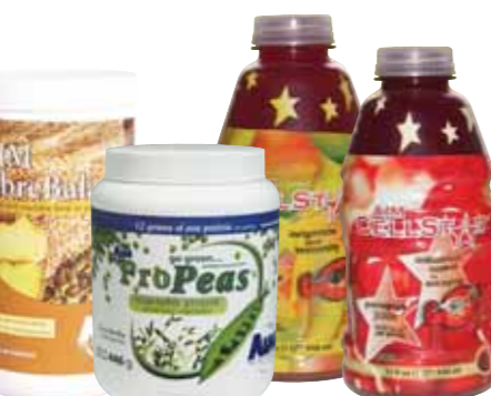
5558F 78 PV