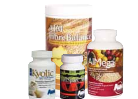
5559F 89 PV