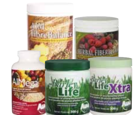
(1) 5570F, (2) 5571F, (3) 5572F et (4) 5573F 78 PV